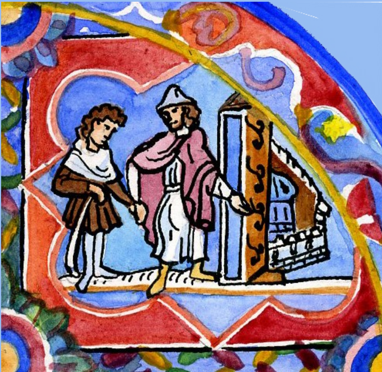
12. Hic, intrat domum filius. Ici, le fils entre dans la maison