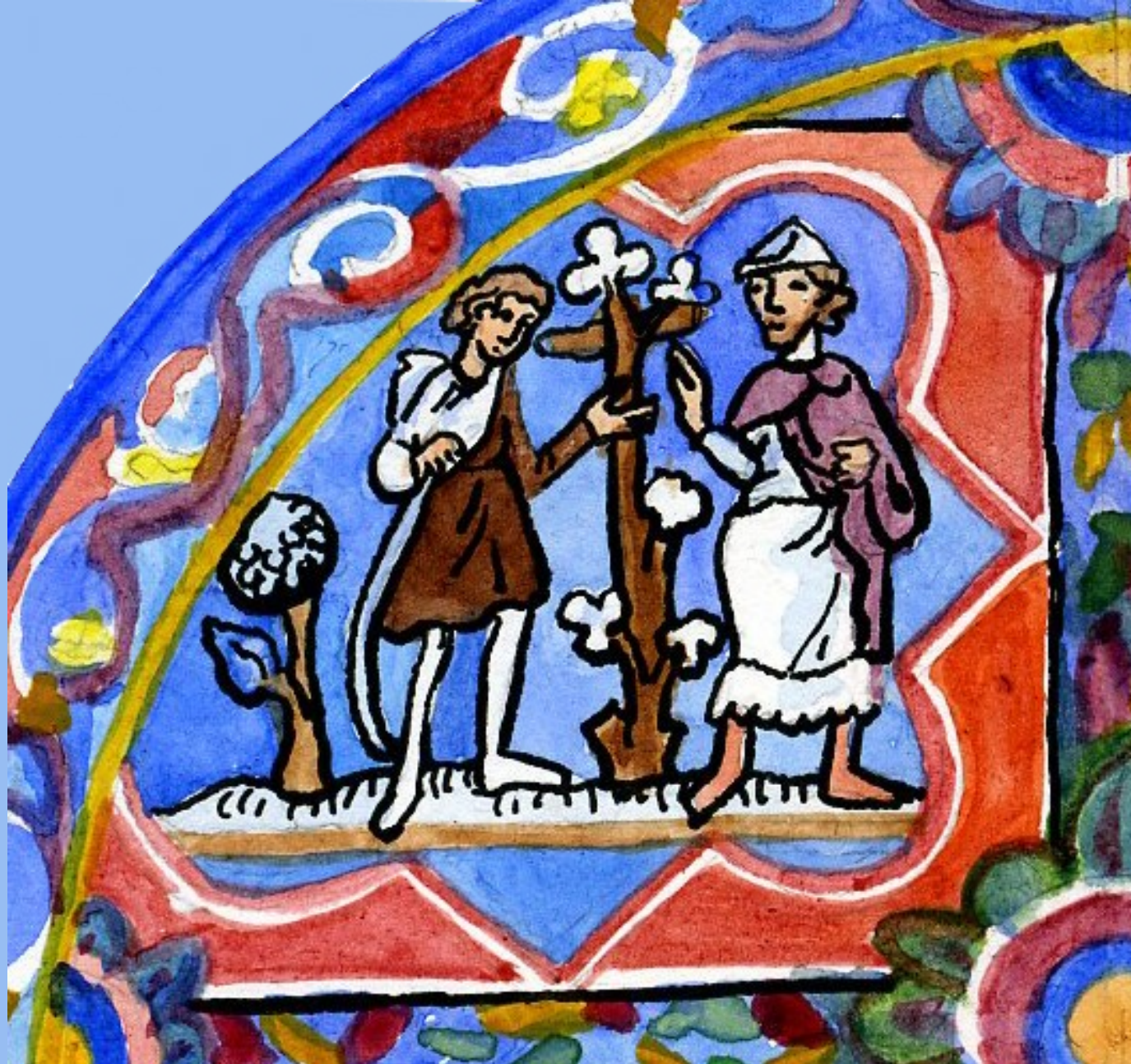
11. Hic, pater loquitur de filio. Ici le père parle de son fils.