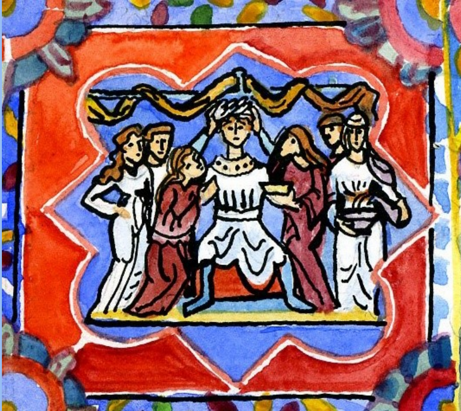
4. Hic, coronatur a meretricibus. Ici, il est couronné par les prostituées.