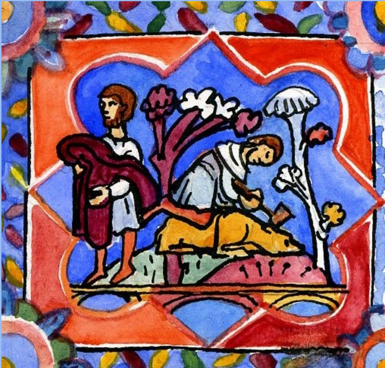
8. Hic, interficitur vitulus saginatus. Ici, le veau gras est sacrifié