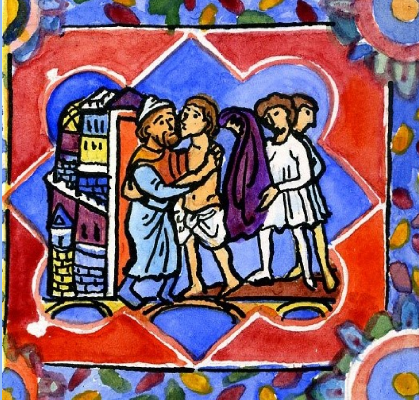
7. Hic, oscultatur pater filium suum. Ici, le père embrasse son fils