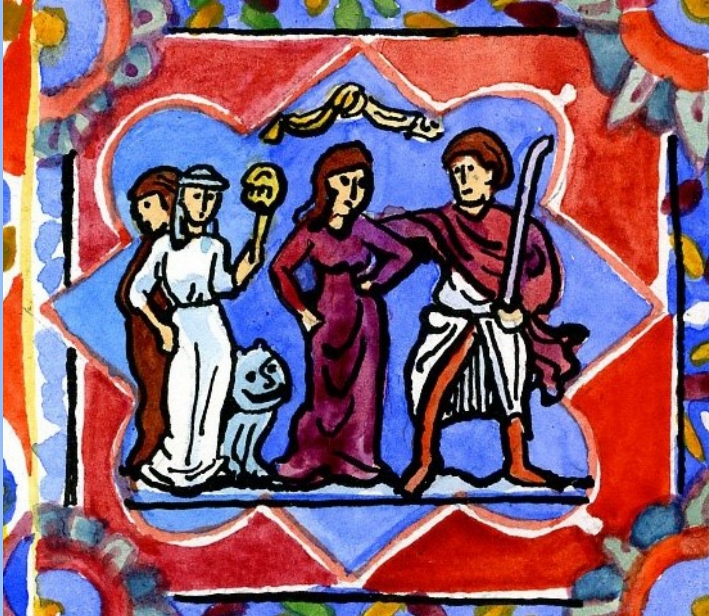
3. Hic, prodigus vadit cum tribus meretricibus. Ici, le prodigue est entraîné par trois prostituées.