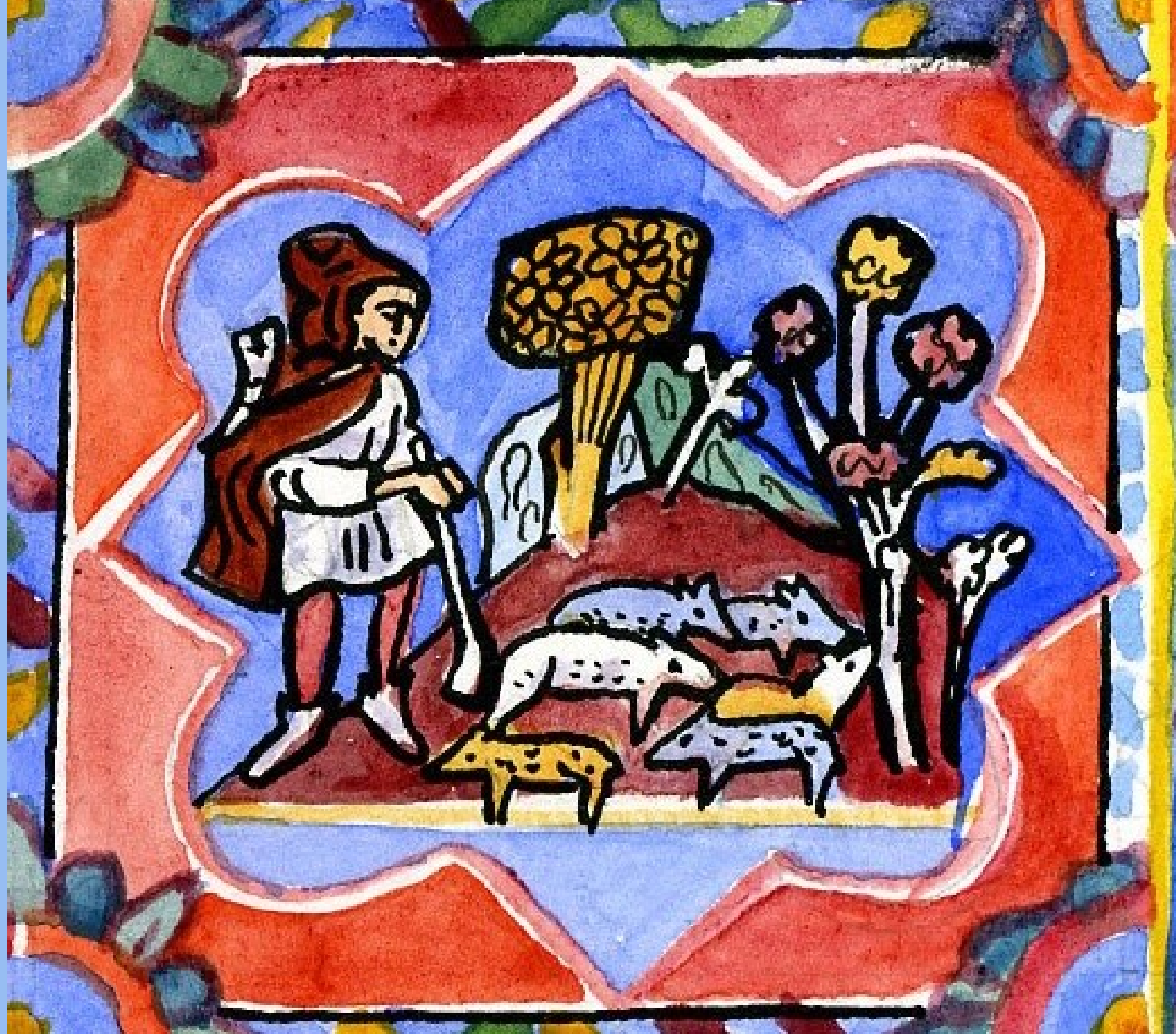
6. Hic, frater prodigi custodit porcos. Ici, le frère du prodigue garde des cochons.