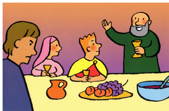
Ton frère était perdu et il est retrouvé