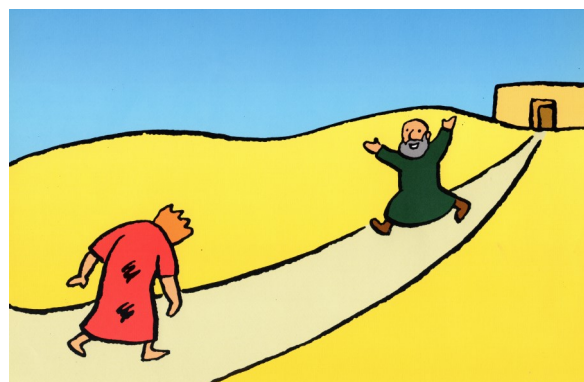
Le fils retourne chez son père