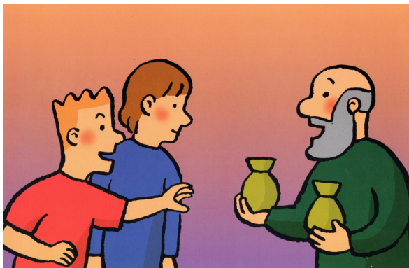
Le père partage ses biens entre ses 2 fils