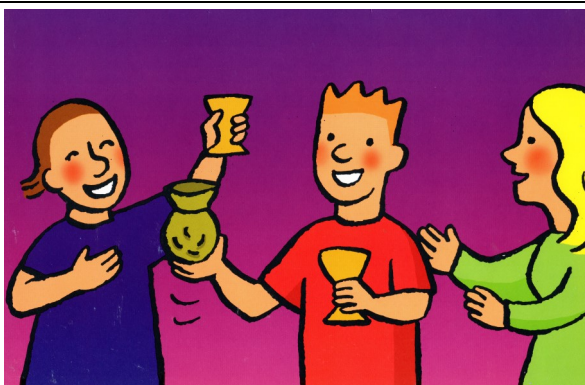
Le fils dépense son argent en faisant la fête