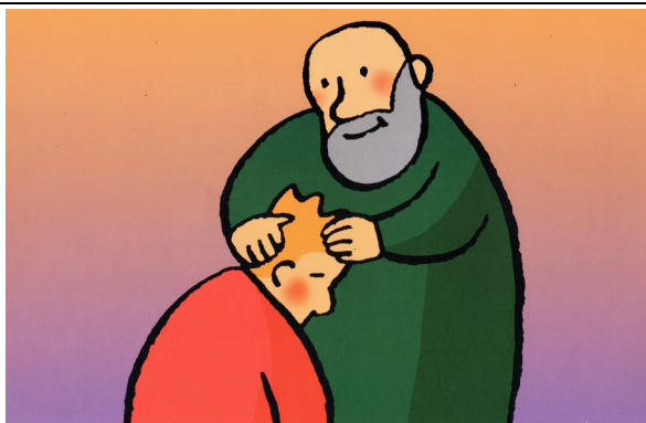
Le père est heureux de retrouver son fils