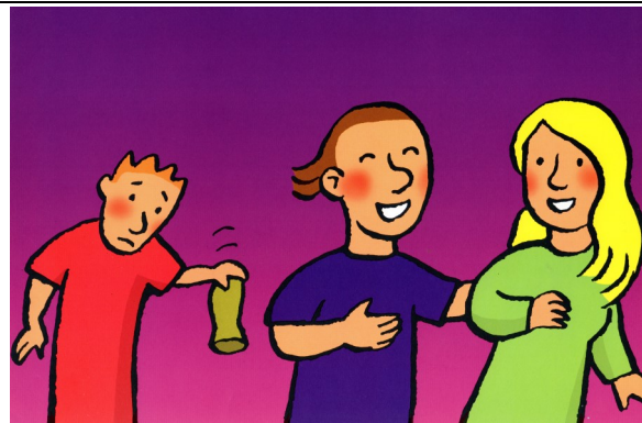
Le fils n'a plus d'argent