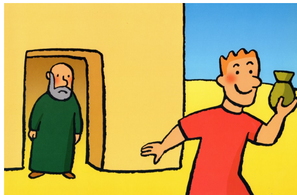
Le fils part avec son héritage