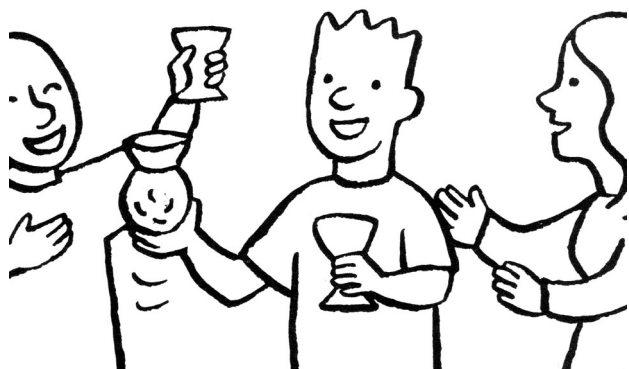
Le fils dépense son argent en faisant la fête