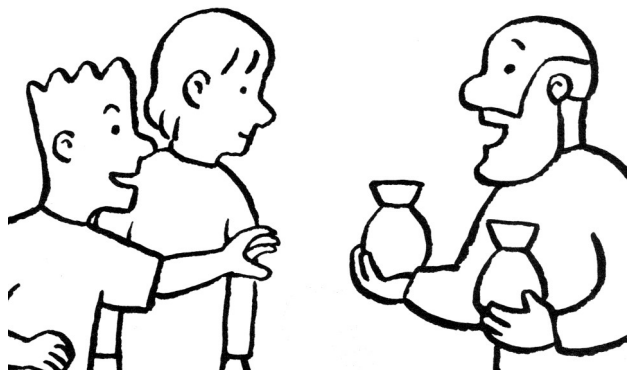
Le père partage ses biens entre ses 2 fils