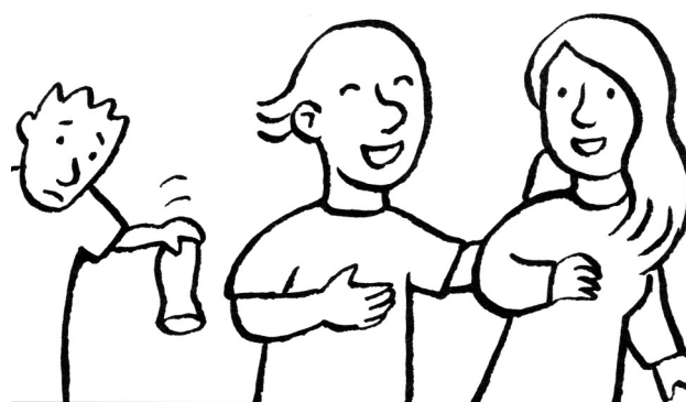
Le fils n'a plus d'argent