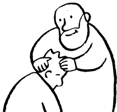
Le père est heureux de retrouver son fils