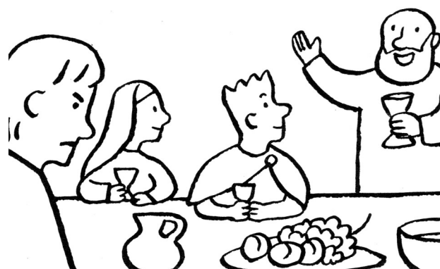
Ton frère était perdu et il est retrouvé