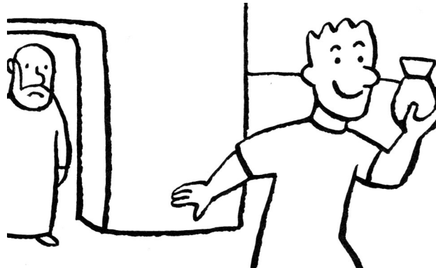
Le fils part avec son héritage