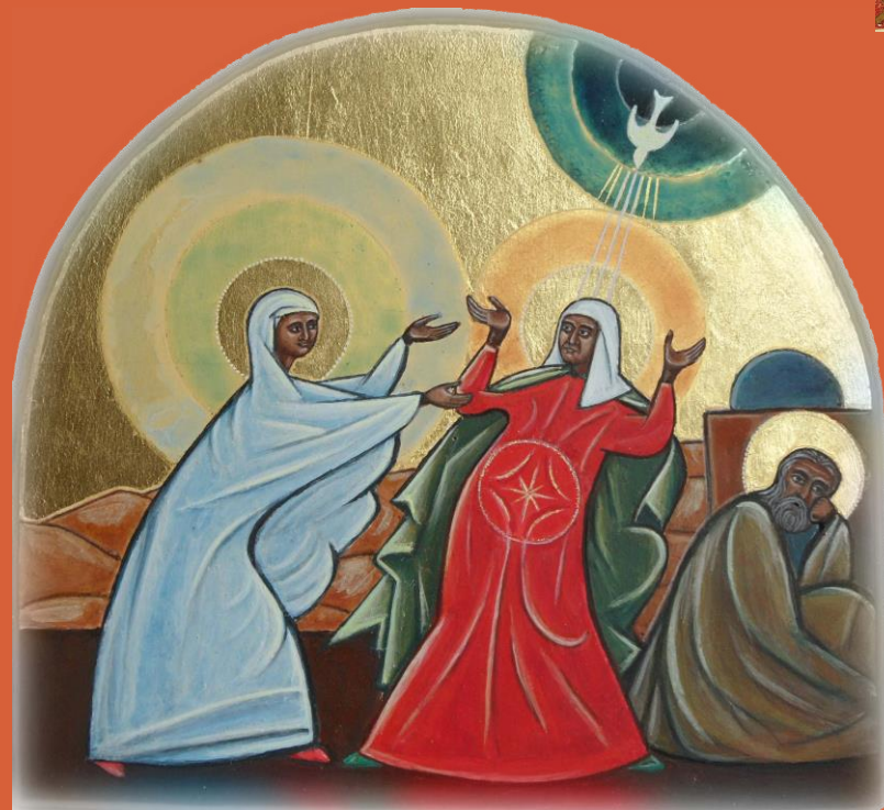
Icône Alain Chenal