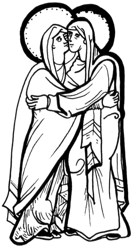
Visitation Evangélaire d'Egbert