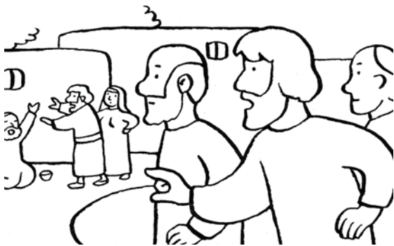
Bartimée crie : « Fils de David, Jésus, prends pitié de moi ! ». Des gens voulaient le faire taire.