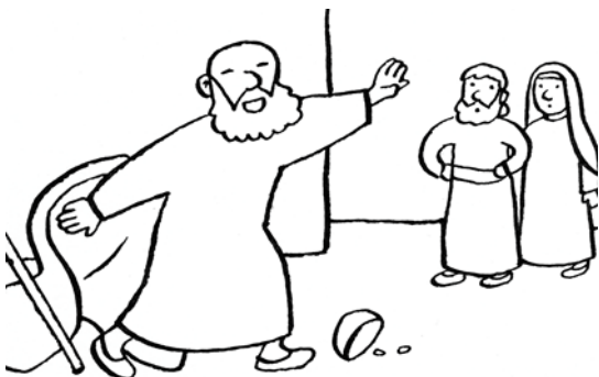
L'aveugle jette son manteau.