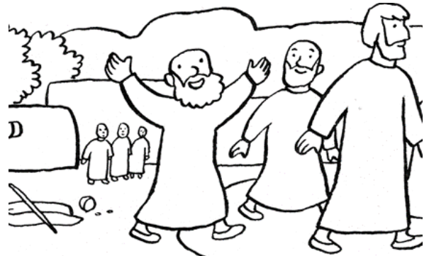
Bartimée retrouve la vue et suit Jésus sur le chemin.