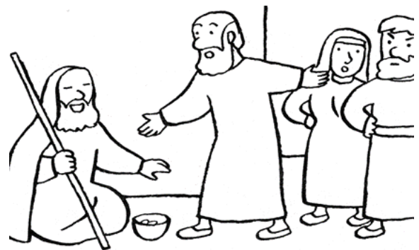
Jésus demande qu'on appelle Bartimée.