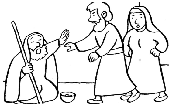
Bartimée, un aveugle mendiant était assis au bord du chemin.